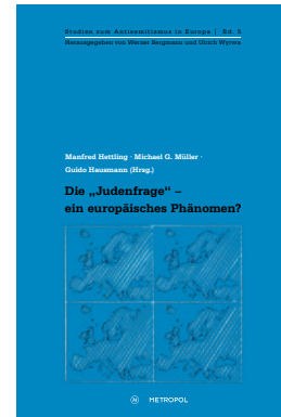
Manfred Hettling, Michael G. Müller, Guido Hausmann (Hrsg.): Die »Judenfrage« – ein euro- päisches Phänomen? (Reihe Studien zum Antisemitismus in Europa, Bd. 5) Berlin 2013

Die Veröffentlichung führt die verstreute Forschung zu den Auswirkungen des Ersten Weltkrieges auf das östliche Europa zusammen und rückt auf diese Weise die von der Forschung unterbelichtete Problematik der Zivilbevölkerung ins Blickfeld. Im Mittelpunkt stehen die Politik Russlands, Österreich-Ungarns und des Deutschen Reiches in Bezug auf die Zivilbevölkerung in frontnahen und besetzten Gebieten sowie eine vergleichende Betrachtung der Situation der Zivilbevölkerung in verschiedenen Ländern und Regionen.