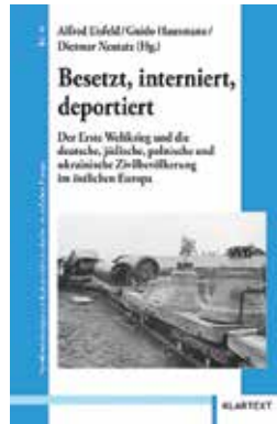
Alfred Eisfeld, Guido Hausmann, Dietmar Neutatz (Hrsg.) Besetzt, interniert, deportiert. Der Erste Weltkrieg und die deutsche, jüdische, polnische und ukrainische Zivilbevölkerung im östlichen Europa (Veröffentlichungen zur Kultur und Geschichte im östlichen Europa, Bd. 39) Essen 2013

So ist in den vergangenen Jahren ein zunehmendes Interesse von Künstlern an Themen wie Heimat und Fremde, Wanderung und Displacement festzustellen. Die Beiträge des Buches diskutieren aus verschiedenen disziplinären Perspektiven, wie Kunstgeschichte, Literatur- und Medienwissenschaft, Soziologie und Kulturanthropologie, welche Bedeutung Einwanderung für künstlerische Produktion und Praktiken, für neue Ideen, Bilder, Methoden und Theorien hat. Migration ist in einem Jahrtausend, das sich durch weltweite Wanderungen definieren wird, auch für Kunst und Kultur ein wichtiger Motor und Katalysator.