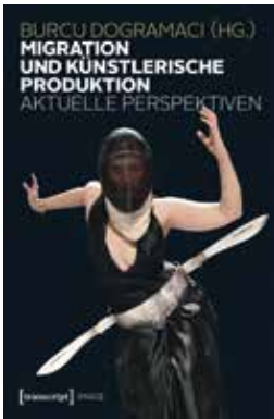
Burcu Dogramaci (Hrsg.) Migration und künstlerische Produktion. Aktuelle Perspektiven Bielefeld 2013

Migration hat als Wechsel des Heimatortes Folgen für die Protagonisten, ihre Herkunfts- und Zielländer: Bewegung und Mobilität können Verlust und Gewinn bedeuten, Heimat(en), Sprachen, Geschichten verändern sich, was sich wiederum sowohl in den Werken künstlerisch arbeitender Migranten niederschlägt als auch Migration selbst zum Gegenstand der Kunst werden lässt.