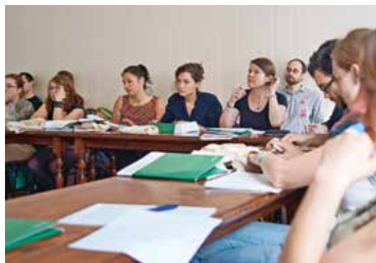
Promovierende und Postdocs, CEU, Budapest