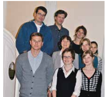
Aleida Assmann mit der Studiengruppe