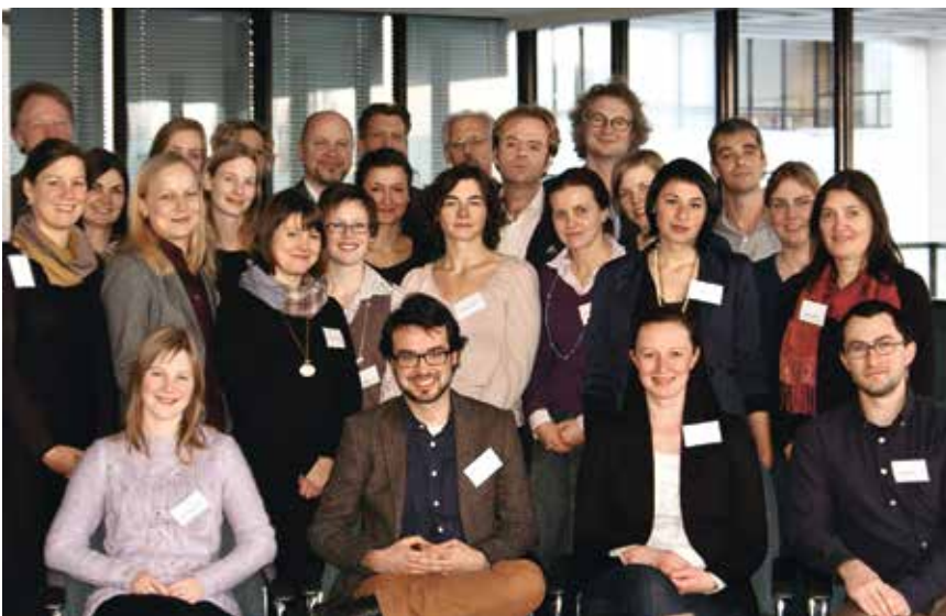
Einführung des ersten Jahrgangs am 6. Dezember 2012